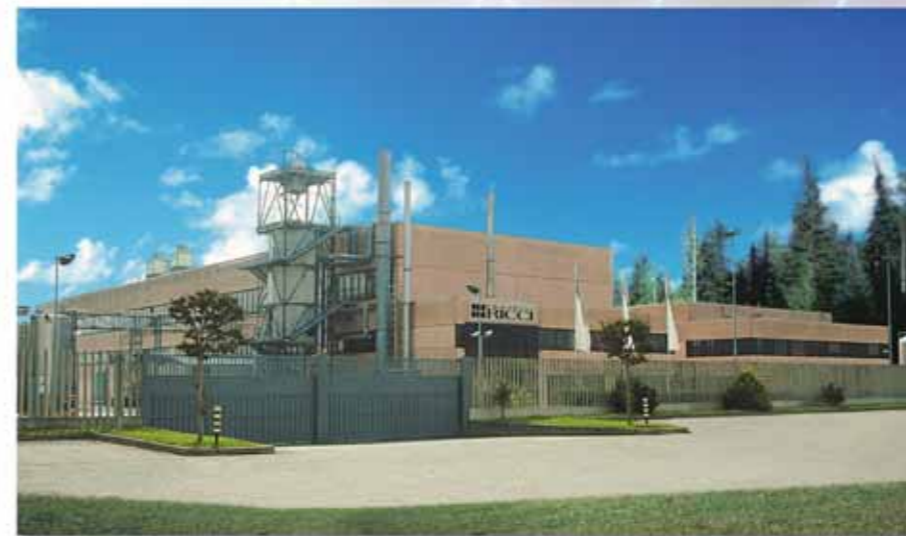
Unità produttiva di Robecchetto