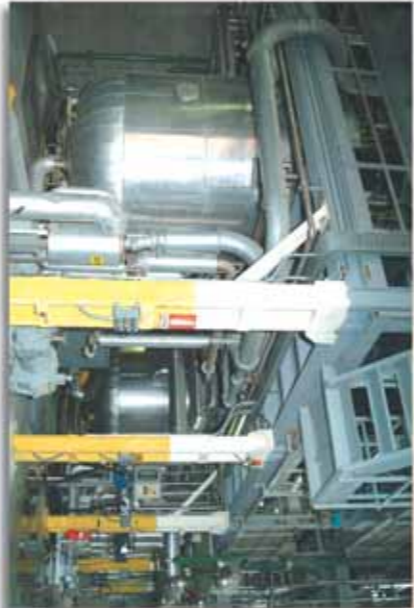
Reparto di Robecchetto