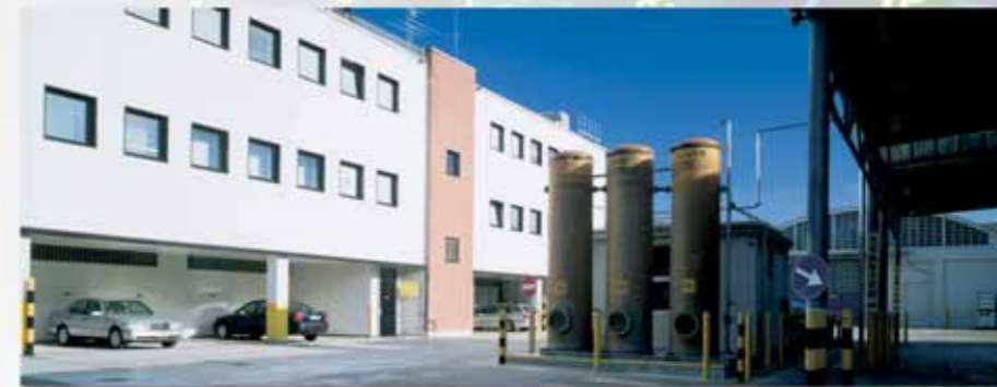
Unità produttiva di Gorla Minore