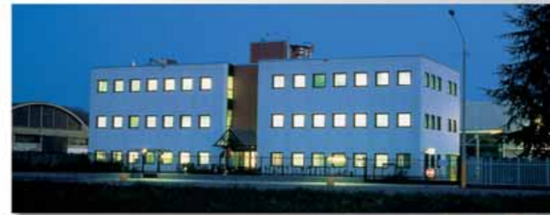
Sede di Gorla Minore

Ricci China Chemical & Co. Ltd No. 1 Paper Mill Road - Baoding City Hebei Province - P.R. China