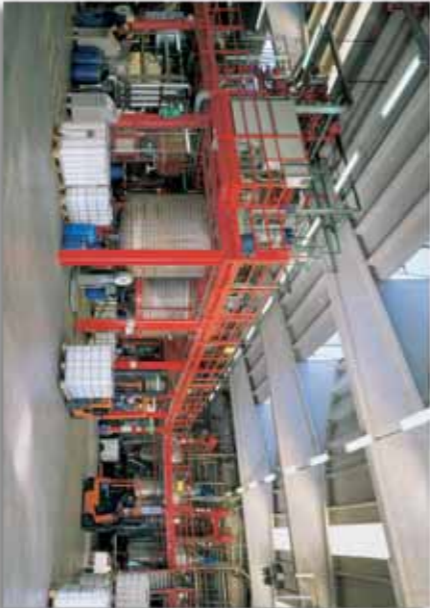
Reparto di Gorla Minore